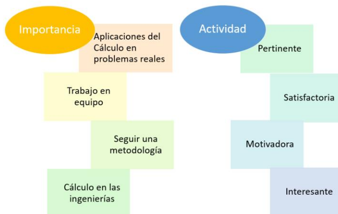
Figura 1. Categorías y subcategorías de los ítems

Por otra parte, se agruparon los ítems en dos categorías: importancia y actividad, de 4 subcategorías cada una, como se muestra en la figura 1.